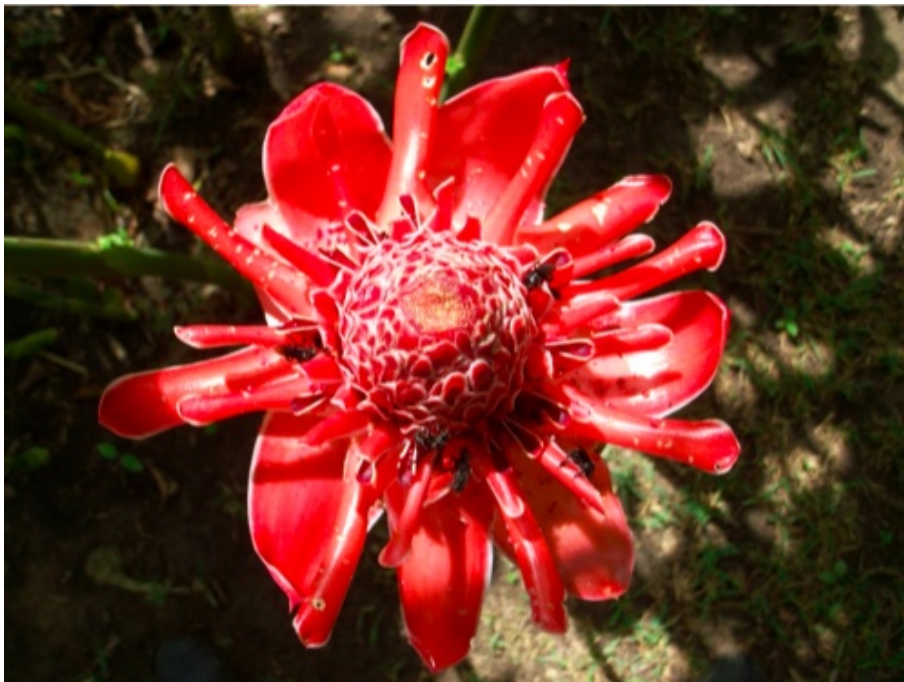
Chez les chamans d'Amazonie

Aujourd'hui, la fleur au fusil, je suis entrain de reprendre un autre flambeau, je me trouve une âme de chamane :