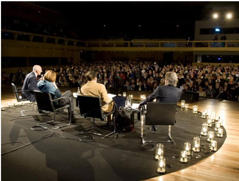
Bâtir une nouvelle société - Edition 2011

Si vous n'avez pas eu la chance de suivre comme moi à l'UNESCO cette nouvelle édition de l'Université de la Terre où près de 20 000 personnes étaient réunies pour débattre sur le thème "Bâtir une nouvelle société", voici en vidéos l'ensemble des entretiens.