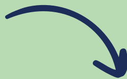
Rythme de baisses interannuelles des émissions brutes depuis 2022

En 2025, le rythme de baisse d'émissions observé a encore ralenti , ce qui reporte les efforts sur les années à venir.