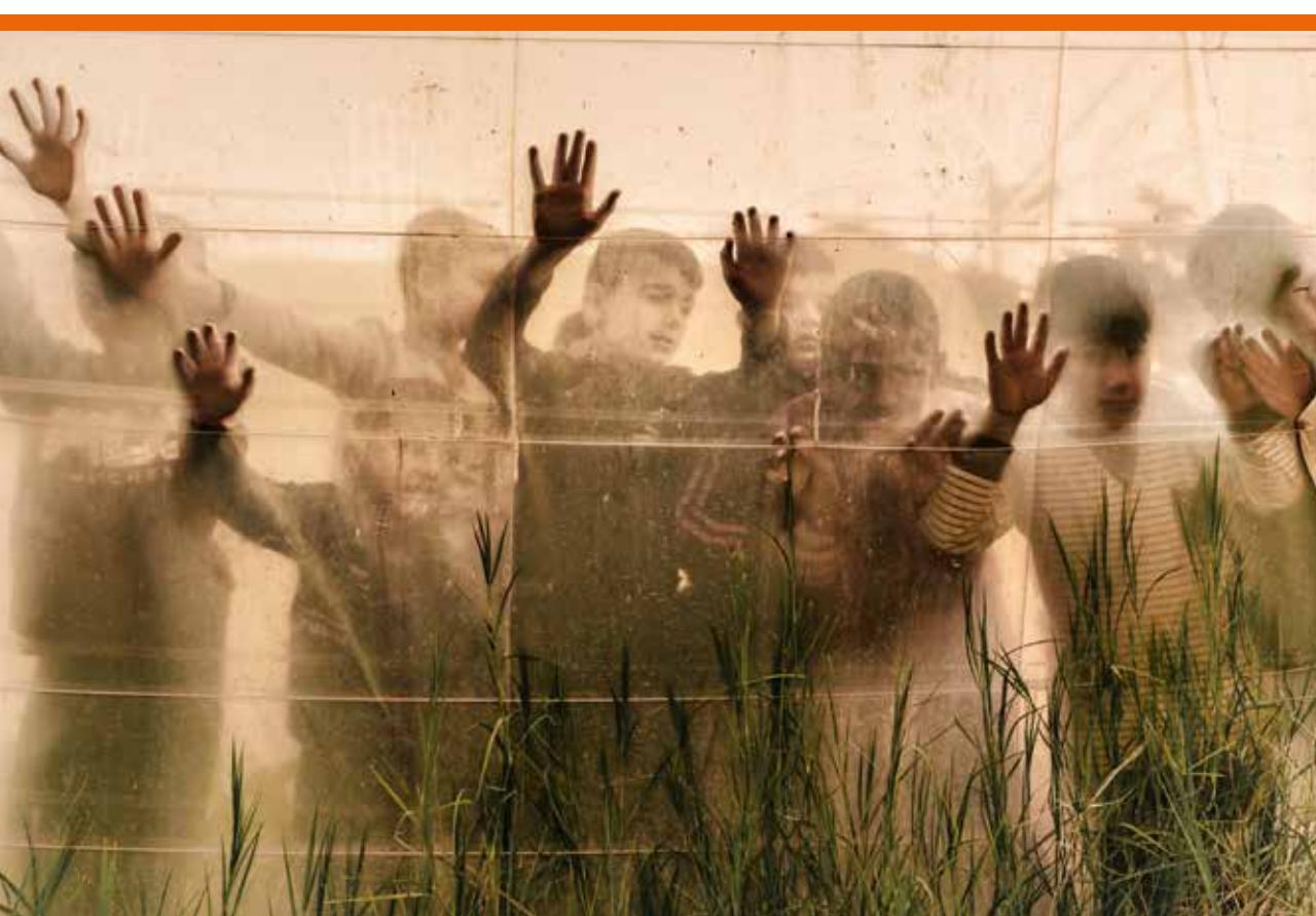
Reportage d'Emily Garthwaite Light between mountains