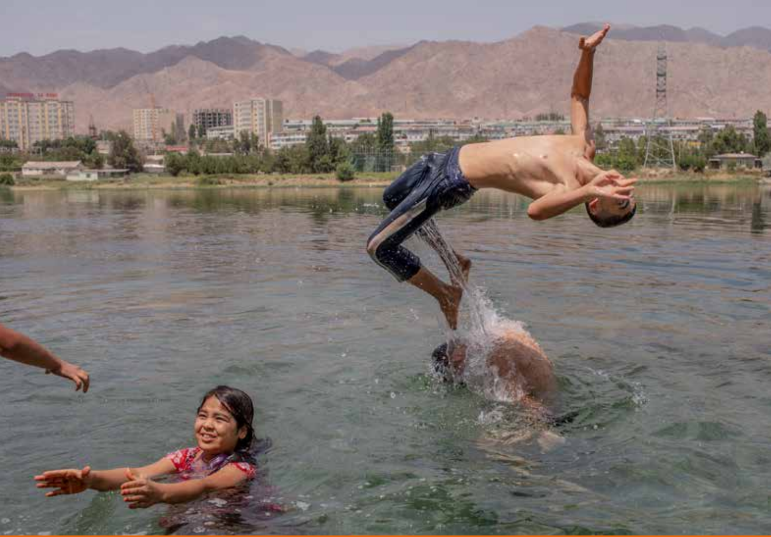
Reportage d'Anush Babajanyan Battered waters