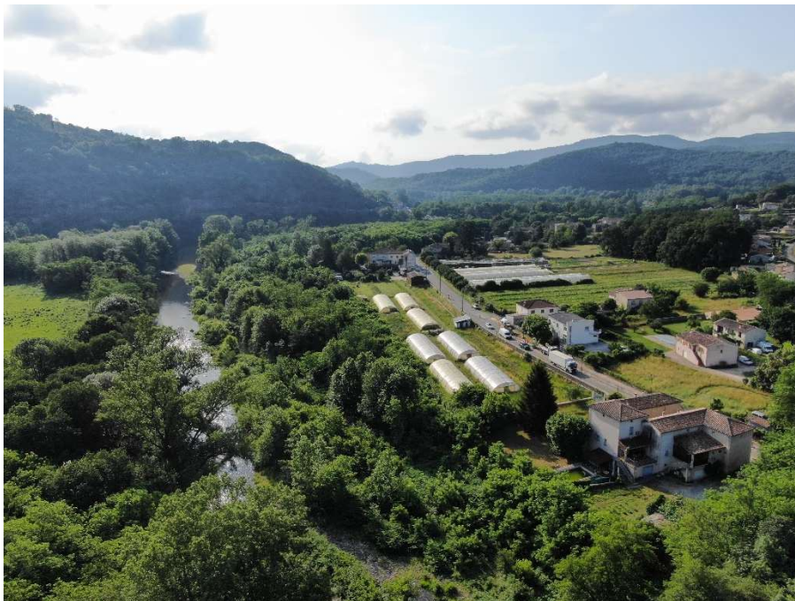
Vue aérienne de la ferme de la Noria

Inaugurée en mai 2023, la ferme La Noria de 4 hectares est consacrée à la production en maraîchage et arboriculture, à l'expérimentation paysanne et à la formation de publics en agroécologie ; elle est aussi vectrice de liens sociaux. L'année 2024 voit réalisations et projets se développer au sein de la ferme autant que sur le territoire du nord du Gard, en synergie avec d'autres acteurs locaux :