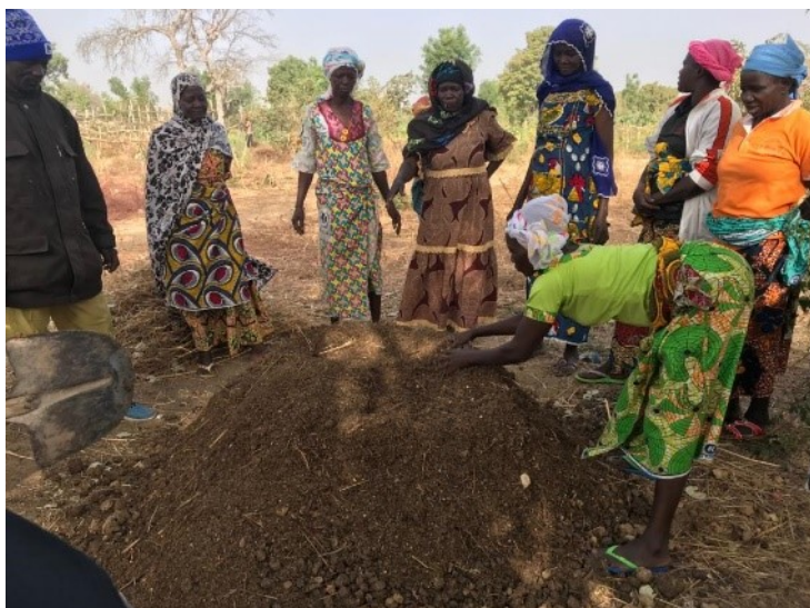
Une séance de formation au Burkina-Faso

Dans ce pays en proie à l'aridification, l'agroécologie constitue une réponse à la dégradation de l'environnement et un facteur clef pour la reconquête de l'autonomie alimentaire des populations . Basée sur la réappropriation des semences paysannes et de la biodiversité cultivée, elle propose une alternative viable aux monocultures de rente et aux OGM très développés au Burkina Faso et dans la sous-région.