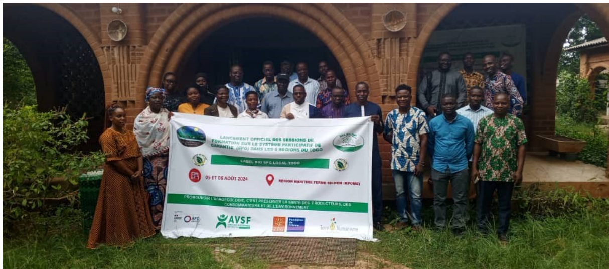
Formation au Togo

des jeunes, les actions permettent la reconquête de la souveraineté alimentaire et l'amélioration des conditions de vie en milieu rural.