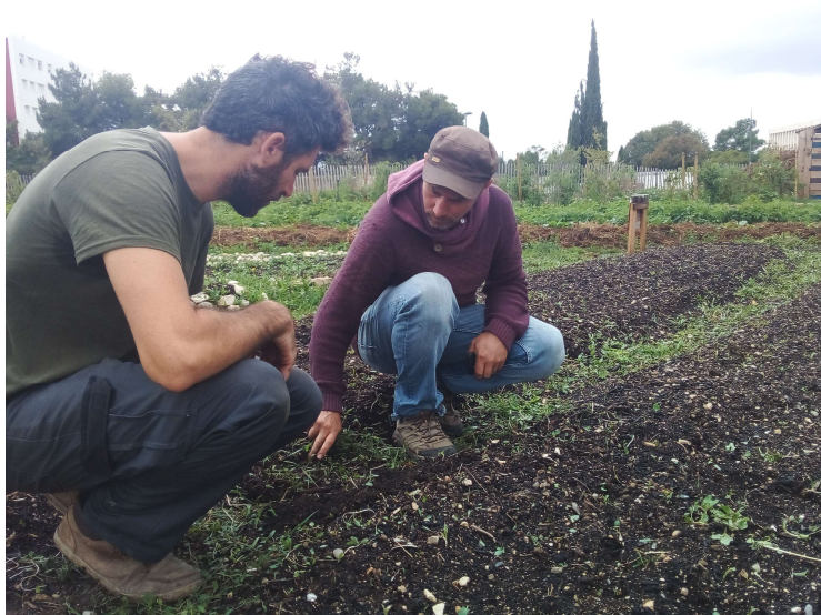
Dans un jardin des Restos du Coeur

● Vivifier les jardins des Restos du Cœur : des jardiniers formateurs de Terre & Humanisme diagnostiquent et dynamisent les sols des jardins des Restos du Cœur ; ils forment aussi les salariés en insertion dans leurs jardins afin que ceux-ci puissent faire face aux aléas climatiques et compléter avec des légumes frais l'aide alimentaire dispensée à leurs bénéficiaires. Depuis septembre 2023, 5 jardins sont accompagnés à Marseille (13), Agen (47), Dijon (21), Laval (53) et Cuissai (61). D'autres jardins sont à venir.