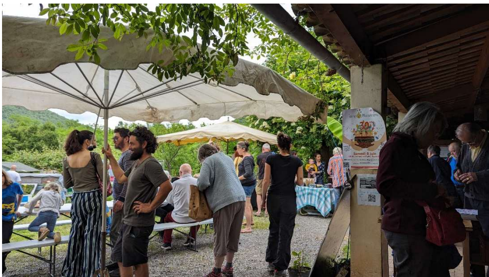
Marché de producteurs – Ferme de la Noria