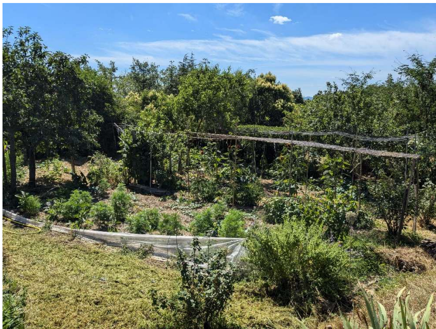
Un des jardins pédagogiques du Mas de Beaulieu