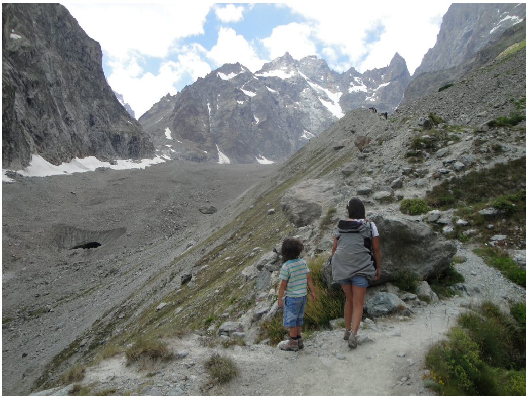
Glacier noir

En 2022, avec le soutien de GMF et du plan France Relance, la passerelle a été reconstruite selon le principe technique initial et au même emplacement mais en surélevant les fondations (culles) d'un mètre afin de la mettre hors d'eau. Un garde-corps à câbles (démontable hors-saison) a été rajouté. Les deux rives ont aussi été aménagées, par la pose de gros blocs, pour permettre la protection de la passerelle des assauts du torrent en crue.