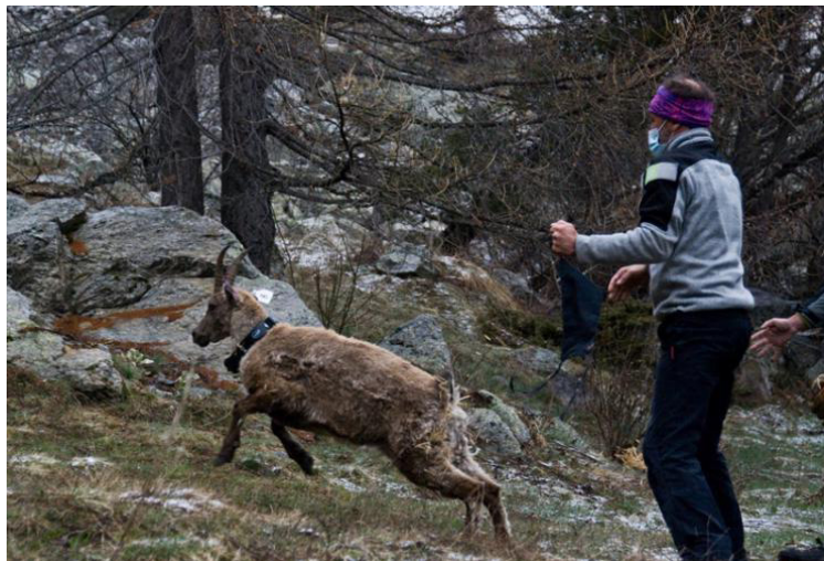
Bouquetin relâché

Fin avril 2021 une action inter-parcs nationaux exceptionnelle a pu voir le jour : la translocation de 19 bouquetins du Parc national de la Vanoise au Parc national du Mercantour .