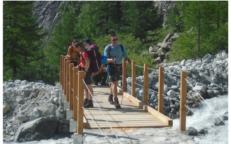
Nouvelle passerelle du glacier Noir

De façon récurrente les crues du torrent bloquent les randonneurs sur la rive gauche et la crue de 2021 a provoqué d'importants dégâts sur les fondations de la passerelle ainsi que sur le platelage en bois. Des travaux de remise en état étaient indispensables pour garantir la sécurité des randonneurs.