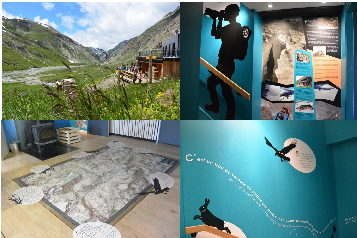
Refuge du Prariond

Depuis 2008, 6 refuges et gîtes ont été aménagés ou rénovés avec le soutien de GMF.