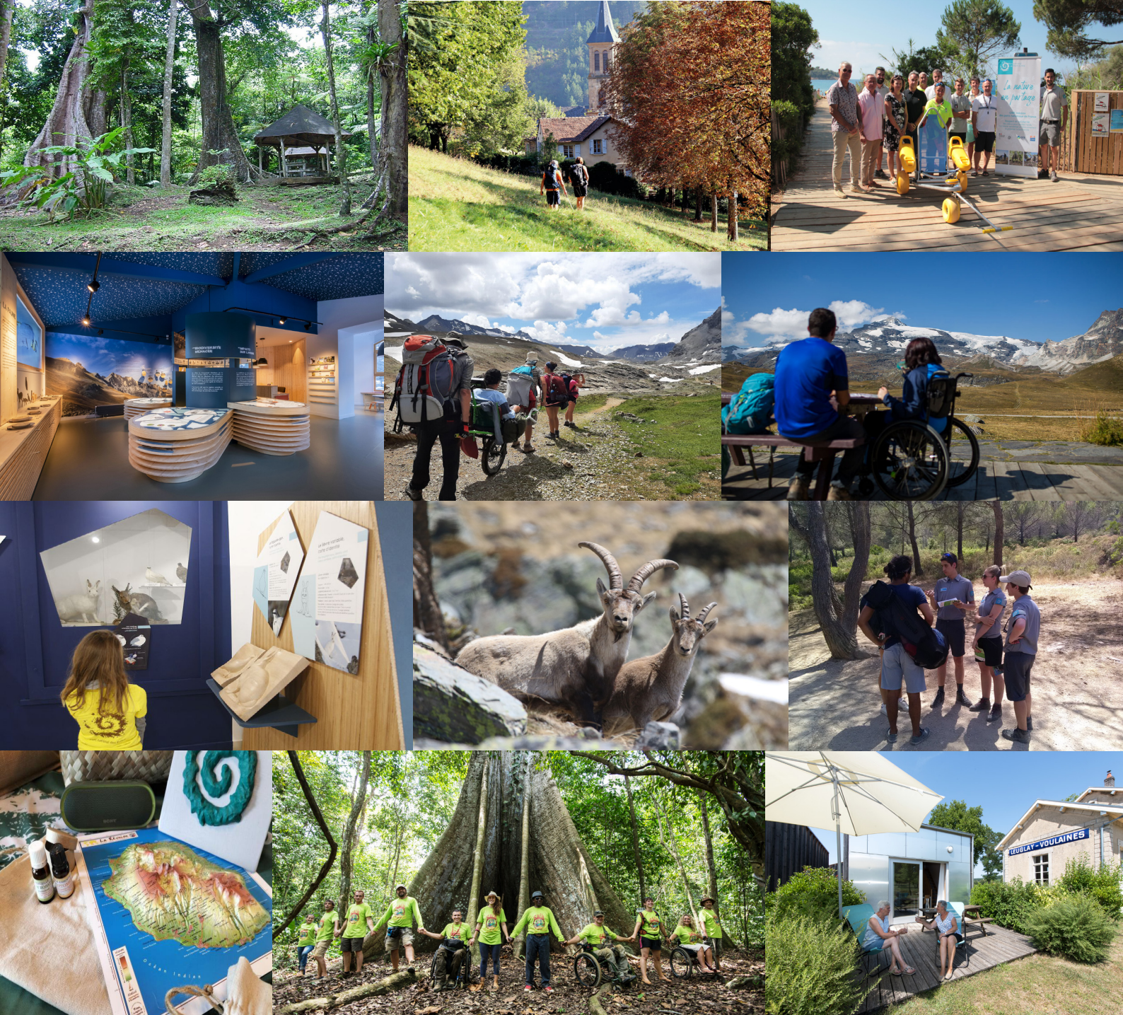
Aire de pique-nique de Beausoleil ; Balade sur le chemin de Stevenson ; Remise du fauteuil Tiralò-plage de Gigaro ; Scénographie de la maison du Parc national à Saint-Etienne-de-Tinée ; Envie de Montagne ; Plan du Lac ; Exposition "Faune d'altitude" à la maison de Parc national de Briançon ; Bouquetin ibérique ; Jeunes en service civique ; Kit pédagogique GMF ; Amazonie pour tous ; Gîte de la gare à Leuglay