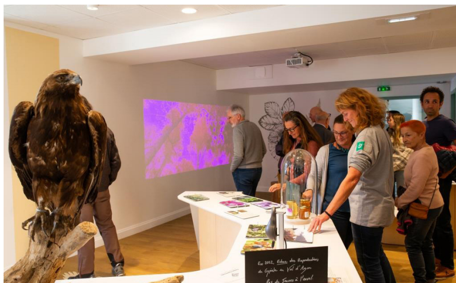
Inauguration de la maison du Parc national des Pyrénées

La découverte de ce sentier se fait en regardant, en touchant ou en manipulant. Il permet à tous les publics de découvrir les secrets du Parc national.