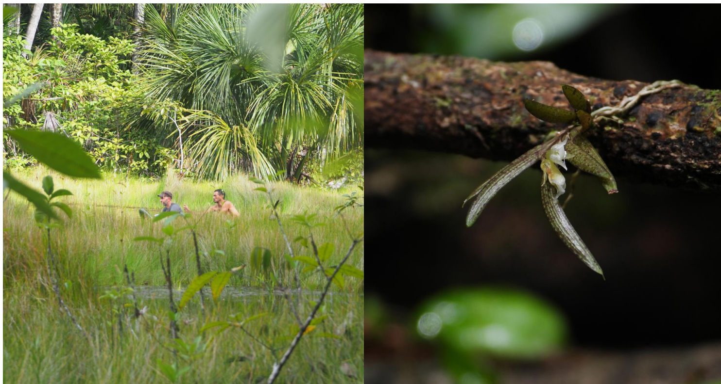
Inventaire au lac Mamilihpan

Depuis 2008, 12 missions d'explorations ou inventaires de biodiversité ont été menés avec le concours de GMF.