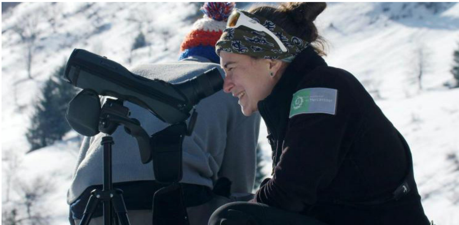
Observation des bouquetins

Découvrez la translocation des 19 bouquetins de la Vanoise au Mercantour