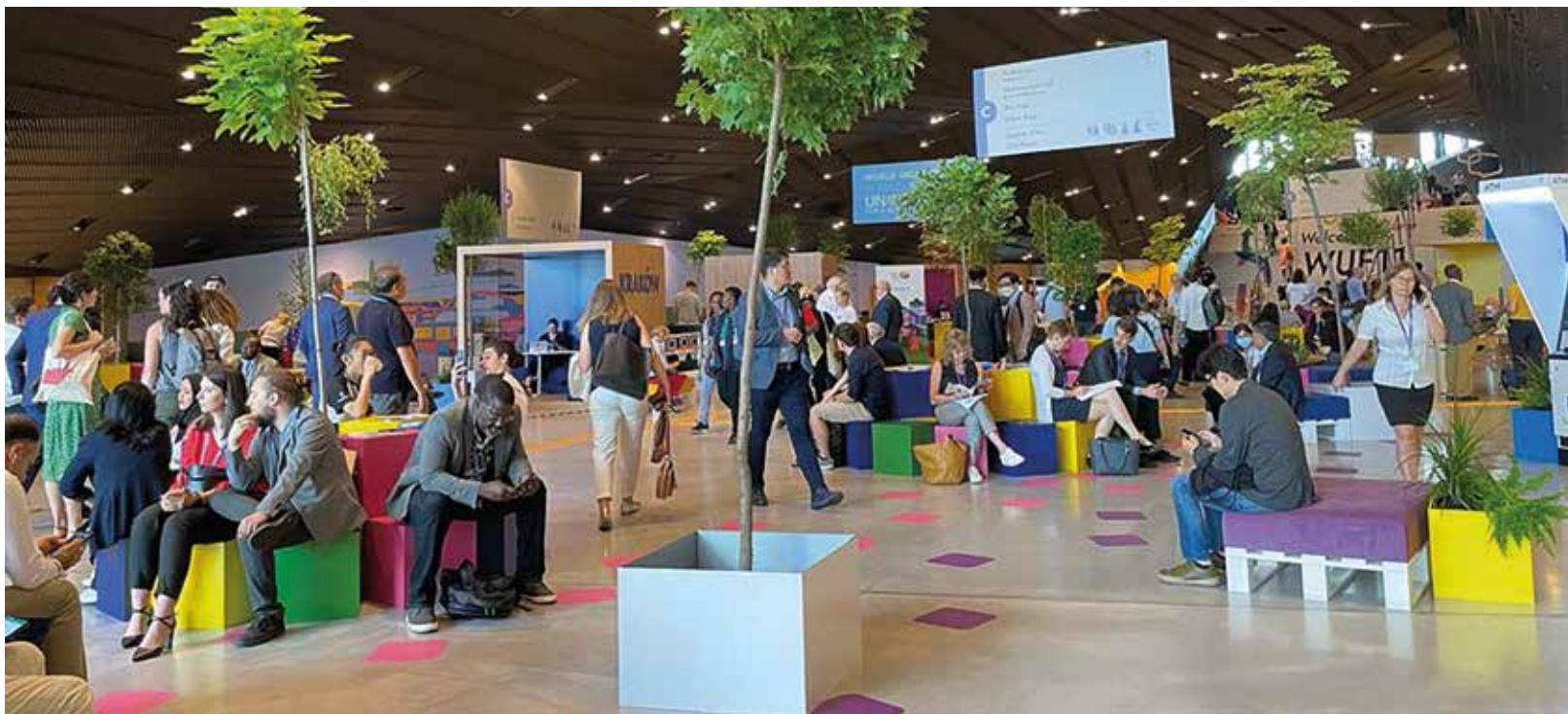
Le 11 e Forum urbain mondial d'ONU-Habitat en juin 2022 à Katowice sur le thème « Transformer nos villes pour un avenir meilleur ».