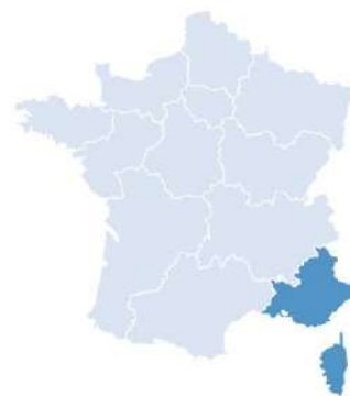
Etats fonctionnels des 252 contextes piscicoles Cours d'eau 1

Ce dernier a été intégré à la feuille de route de l'AGORA et de l'Agence Régionale pour la Biodiversité en tant qu'outil d'aide à la décision. Il a également été présenté en webinaire aux acteurs de la GEMAPI par le biais du RRGMA (Réseau Régional des Gestionnaires de Milieux Aquatiques) de l'ARBE PACA et déjà été utilisé par certains EPTB (intégration dans le diagnostic du PAPI Durance par exemple).