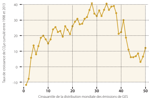
FIGURE E.2. COMMENT LES ÉMISSIONS DE CO 2 e ONT-ELLES ÉVOLUÉ ENTRE KYOTO ET PARIS POUR DIFFÉRENTS GROUPES D'ÉMETTEURS ?

Lecture: le groupe représentant les individus les 2 % les moins émetteurs au monde a vu ses émissions de CO 2 e par tête baisser de 12 % en 1998 et 2013.