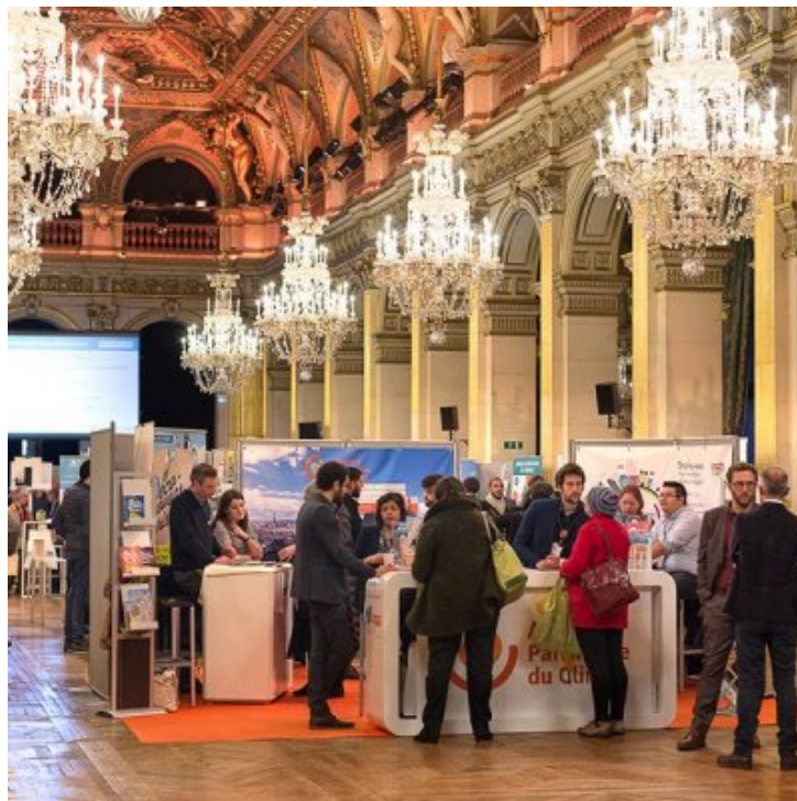
Forum de l'éco-rénovation en copropriété