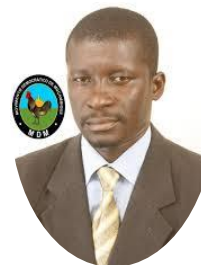
Manuel de Araújo, Maire de Quelimane, Mozambique