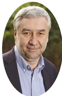
Ronan Dantec, Sénateur français, Porte-parole climat de CGLU et Président de Climate Chance