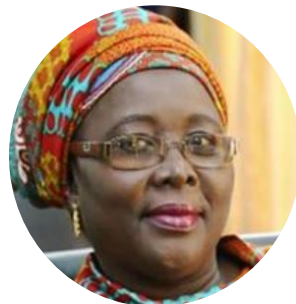
Hon. Hajia Alima Mahama, Ministre des Gouvernements Locaux et du Développement Rural, Ghana