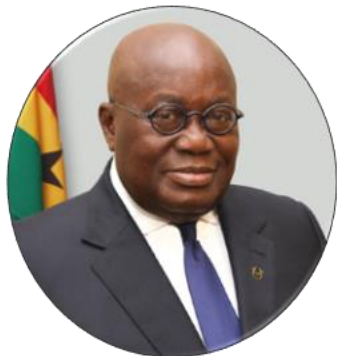
Nana Akufo-Addo Président de la République du Ghana