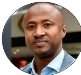
Seyni Nafu, Chef Négociateur du groupe Afrique à la convention de l'ONU sur les changements climatiques