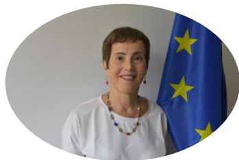
Diana Acconcia, Ambassadrice de la Délégation de l'Union européenne au Ghana, representant la DG Climate Action