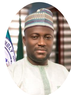
Adjei Sowah, Maire d'Accra