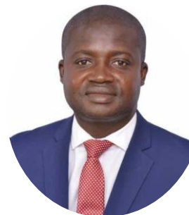
Hon. Bismark Baisie Nkum, Président de NALAG