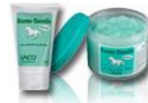
Soulager l'arthrose cervicale