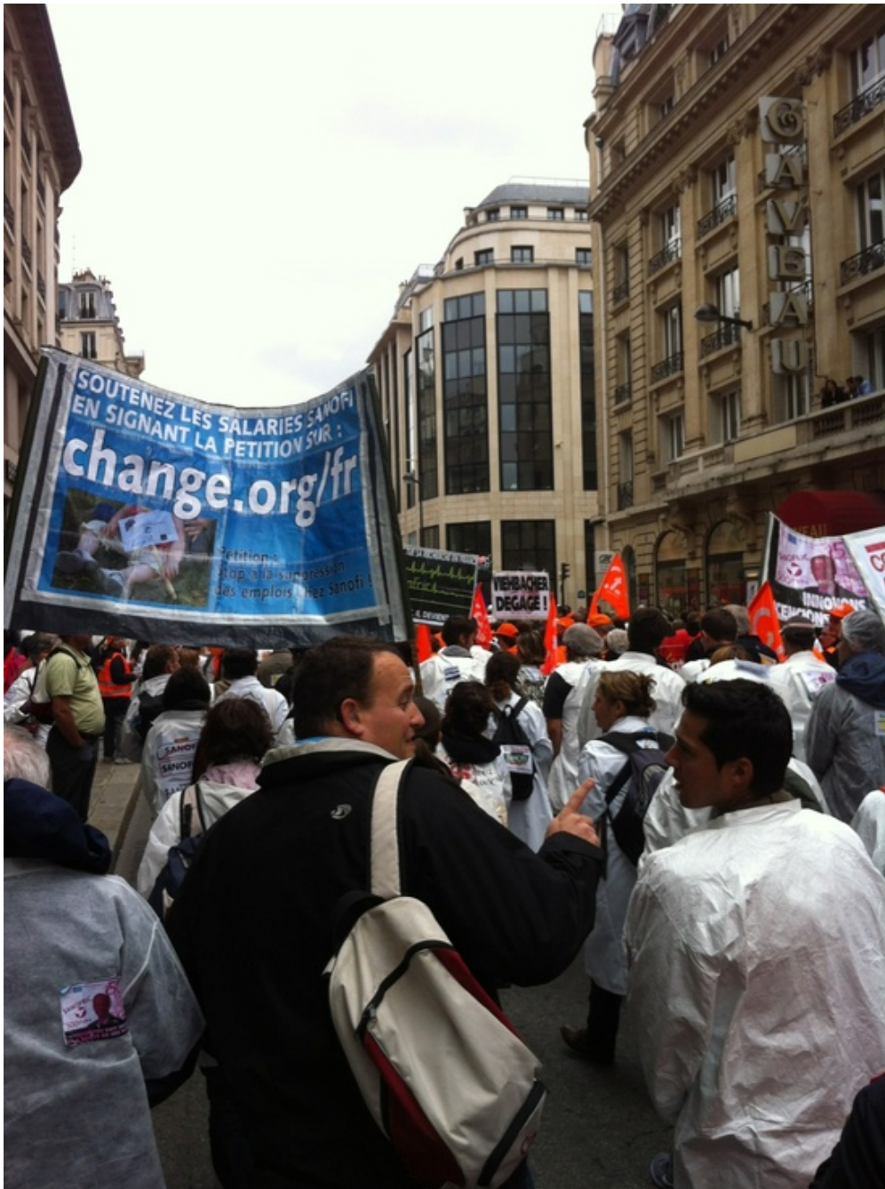
Les Salariés de Sanofi défilent dans les rues de Paris pour la sauvegarde de leurs emplois.