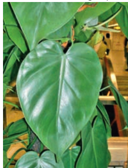
Philodendron grim pant