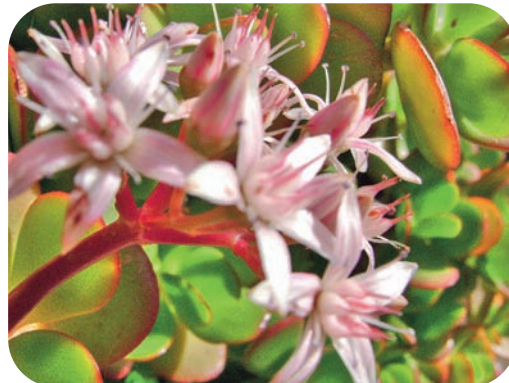
Arbre de jade