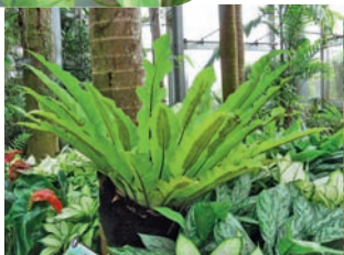
Fougère nid d'oiseau

Beaucoup d'humidité qui plaira aux plantes tropicales. Celles-ci se régaleront des vernis à ongles, aérosols et produits parfumés ( toluène , benzène , formaldéhyde ), mais aussi des lessives et assouplissants du lave-linge ainsi que des effluves de monoxyde de carbone du chauffe-eau (pensez à le faire réviser régulièrement).