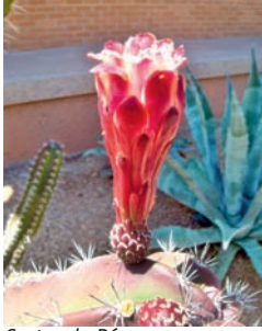
Cactus du Pérou