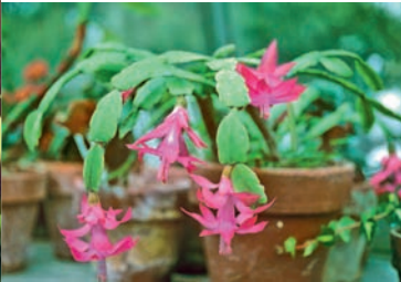
Cactus de Noël