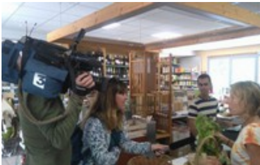
France 3 – Reportage diffusé dans le journal régional Occitanie le 7 juin 2017 et dans l'édition nationale du 19/20