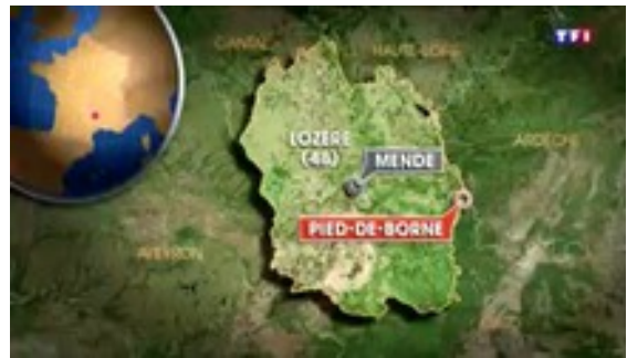
Reportage diffusé le 10 juillet 2017 et sur LCI