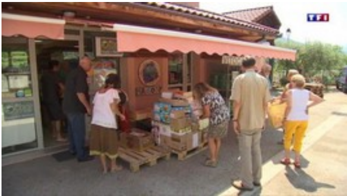
TF1 – Journal de 13h00 de Jean-Pierre Pernaut

Cette année, médias régionaux et nationaux sont venus à Pied-de-Borne réaliser des reportages sur notre petite épicerie :