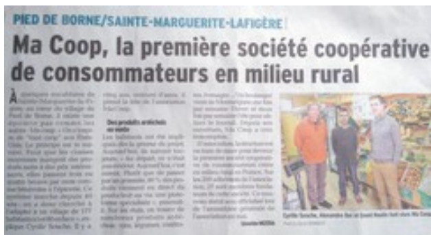
Dauphiné Libéré édition Ardèche (mars 2017)

mais aussi : France Info – L'écho des Cévennes (automne 2017 N°131)